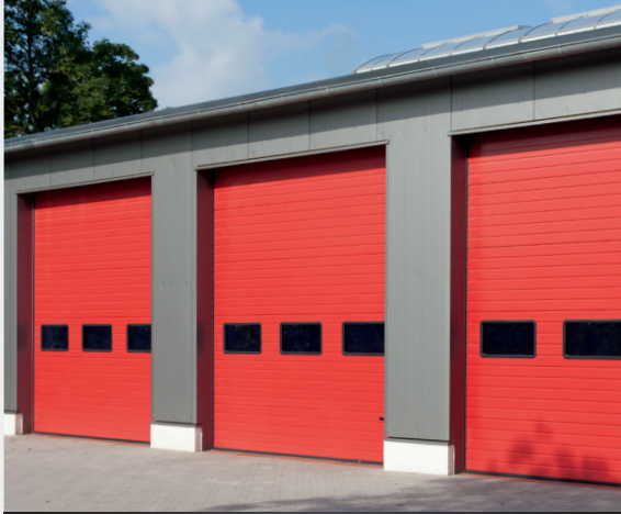
Witterungs- und farbtun stabil